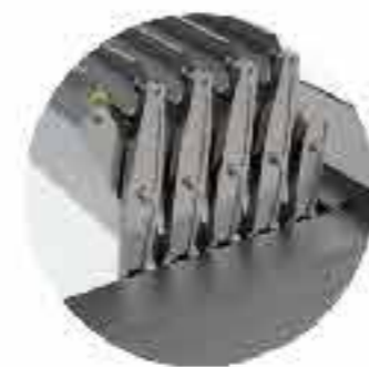
لوور های آلومینیومی