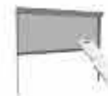
Zip curtain system