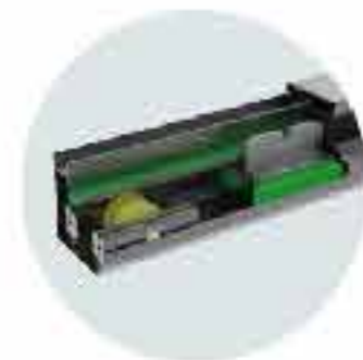
پروفیل آلومینیومی ریل