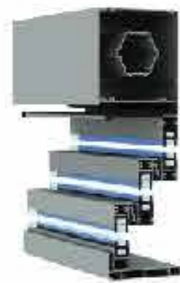
پروفیل و قالب های آلومینیومی

مکانیزم شیشه های گیوتینی مبتنی بر یک موتور الکتریکی می باشد که به وسیله ریموت کنترل دستور من پذیرد و عملیات اصلی که جمع و باز شدن اسلاید های شیشه است، انجام می شود. ایجاد دهانه های طولیل شیشه ای تا طول ۴ متر و حداکثر ارتفاع ۳ متر امکان پذیر بوده و در حین باز و بسته شدن، موتور حرکتی آرام و بی صدا خواهد داشت.